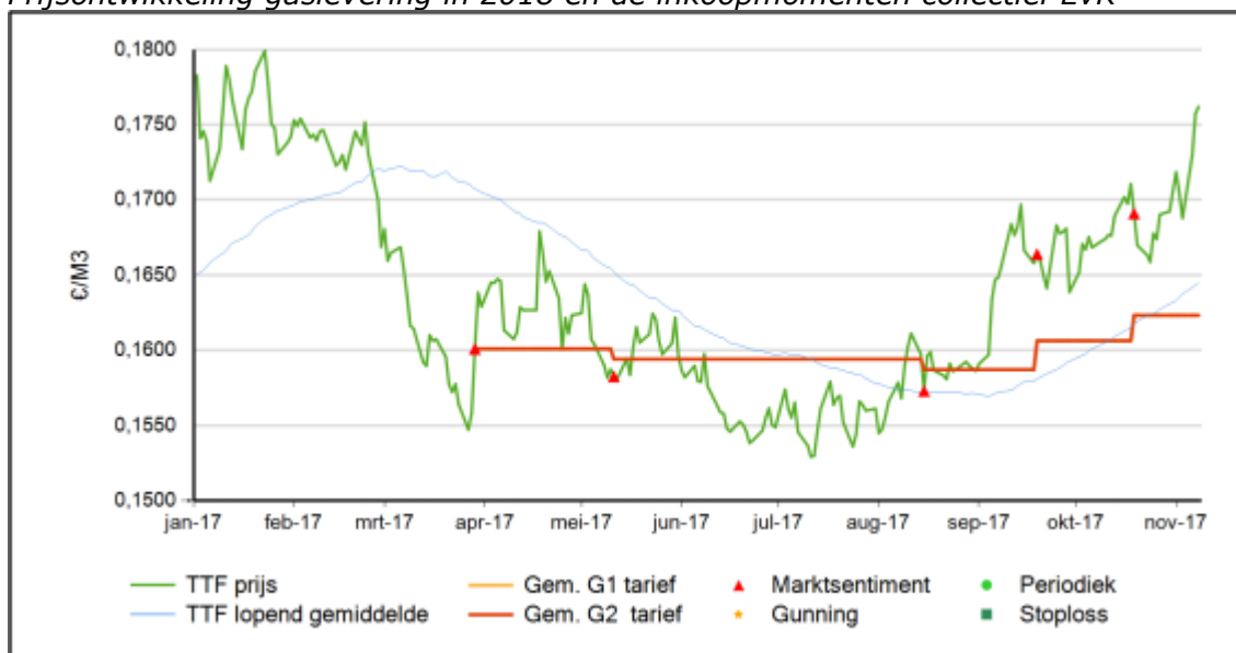
Prijzontwikkeling gaslevering in 2018 en de inkoopmomenten collectief EvK